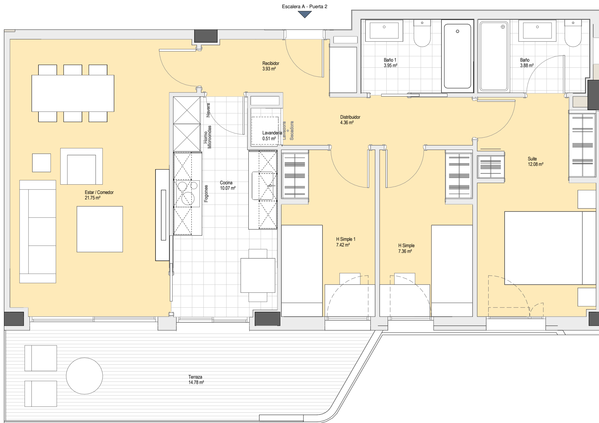
Vivienda Tipo 3D02 1:50 (A3)