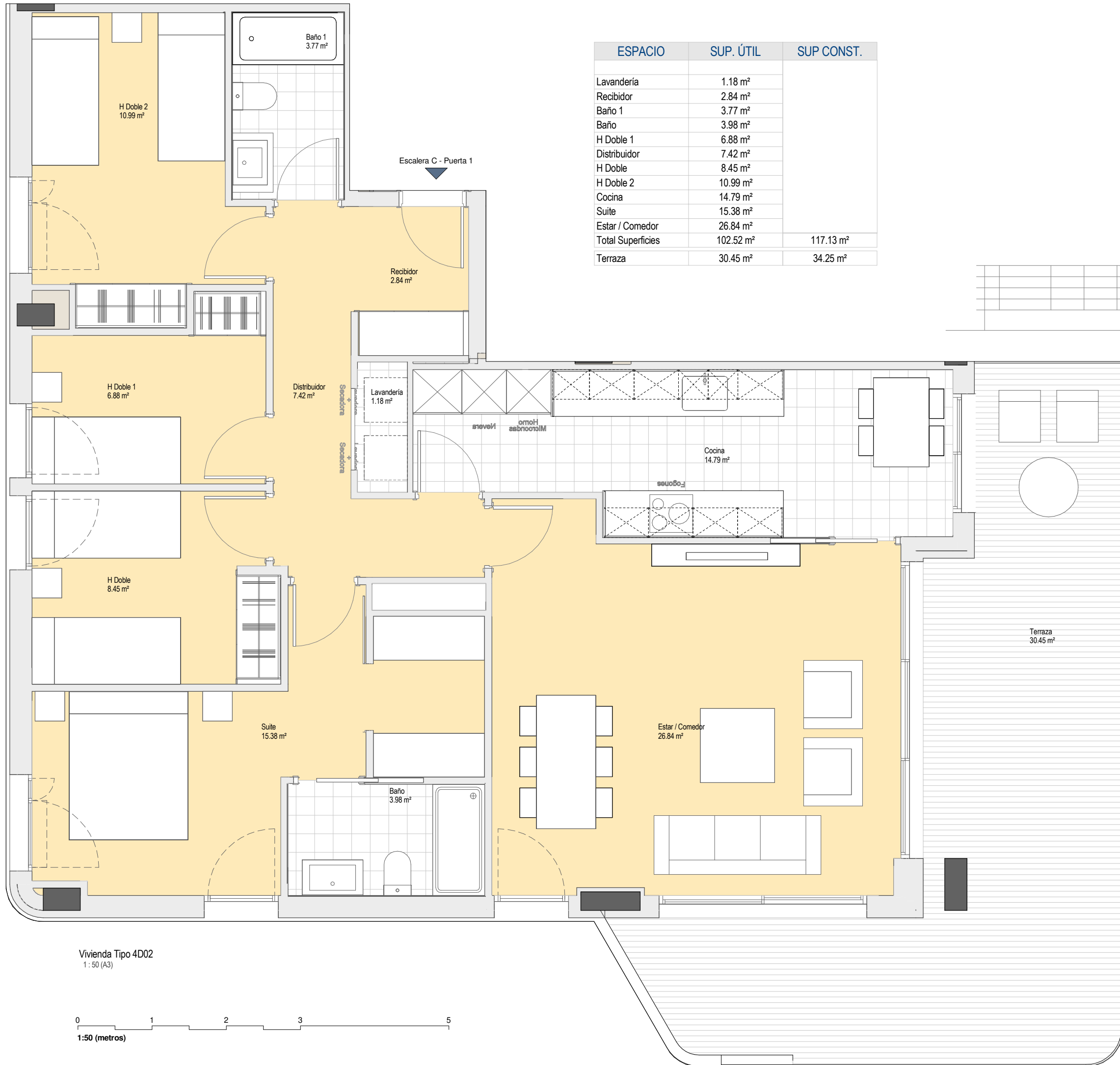
Vivienda Tipo 4D02 1:50 (A3)

LAS CARACTERÍSTICAS DE LA VIVIENDA Y SUS INSTALACIONES QUEDA SUPEDITADA A LAS EXIGENCIAS DE LAS NORMATIVAS VIGENTES, ASÍ COMO A LAS SOLUCIONES TÉCNICAS DETERMINADAS POR LA DIRECCIÓN FACULTATIVA, PLANO DEL PROYECTO EJECUTIVO, SUJETO A MODIFICACIONES EN LA OBRA Y A CRITERIO DE LA DIRECCIÓN FACULTATIVA. LAS SUPERFICIES DEFINITIVAS, SERÁN LAS RESULTANTES DE LA EJECUCIÓN DE LA OBRA.