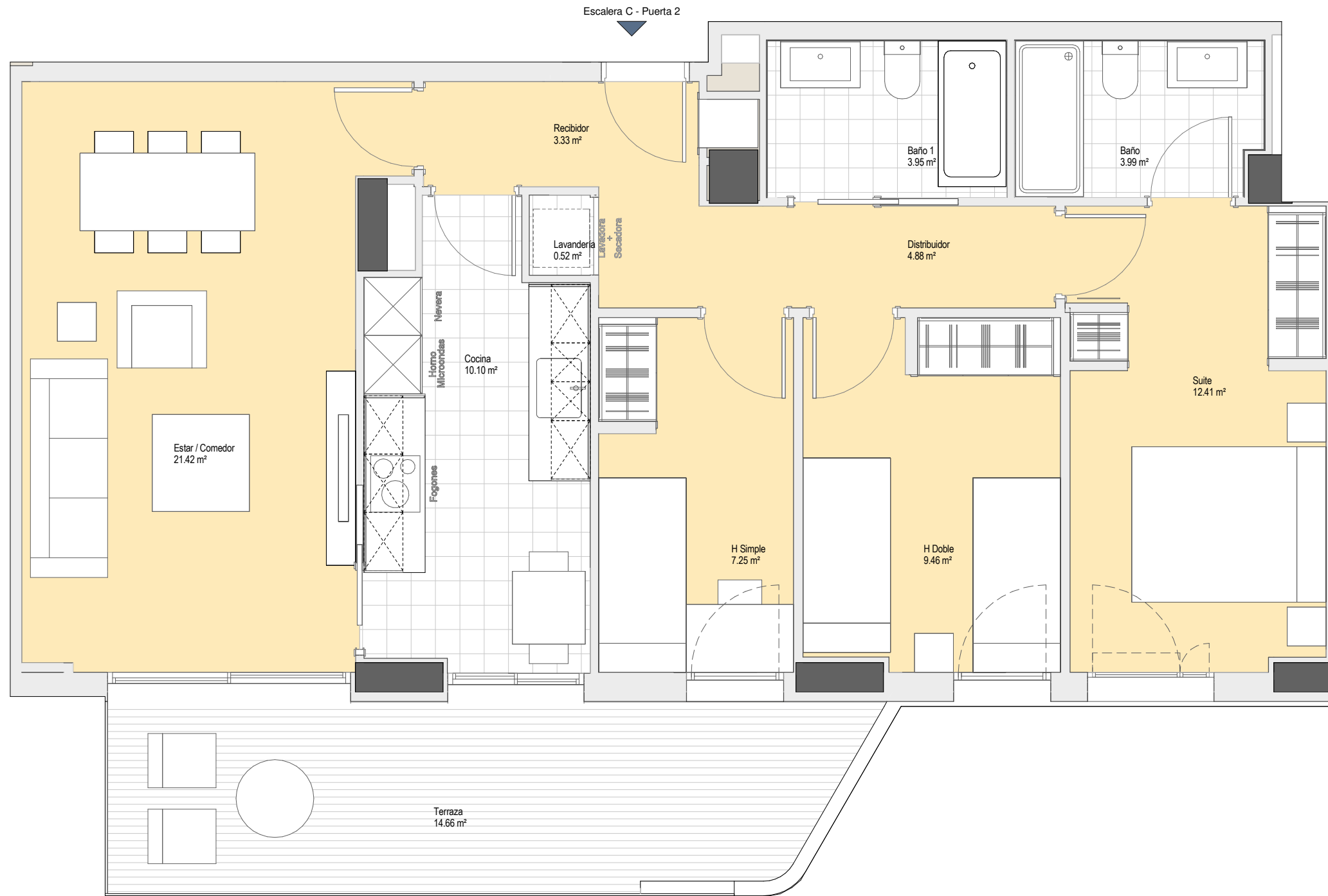
Vivienda Tipo 3D04 1:50 (A3)