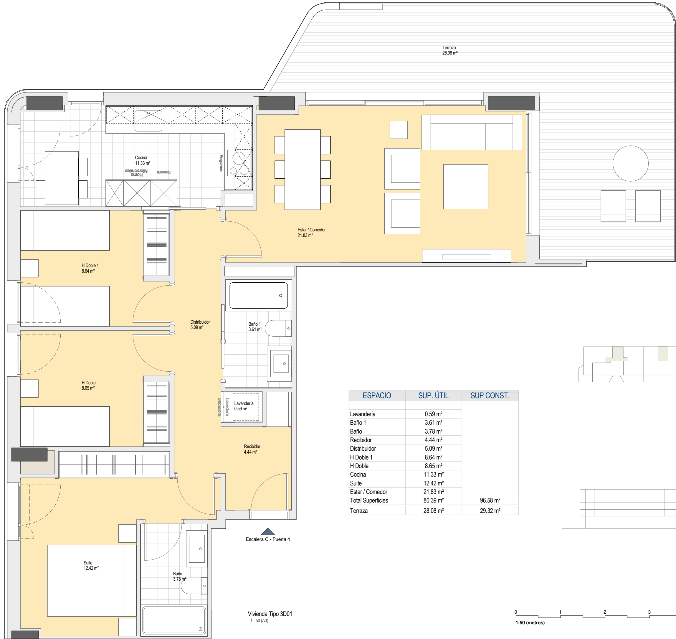
Vivienda Tipo 3D01 1: 50 (A3)

LAS CARACTERÍSTICAS DE LA VIVIENDA Y SUS INSTALACIONES QUEDA SUPEDITADA A LAS EXIGENCIAS DE LAS NORMATIVAS VIGENTES, ASÍ COMO A LAS SOLUCIONES TÉCNICAS DETERMINADAS POR LA DIRECCIÓN FACULTATIVA, PLANO DEL PROYECTO EJECUTIVO, SUJETO A MODIFICACIONES EN LA OBRA Y A CRITERIO DE LA DIRECCIÓN FACULTATIVA. LAS SUPERFICIES DEFINITIVAS, SERÁN LAS RESULTANTES DE LA EJECUCIÓN DE LA OBRA.