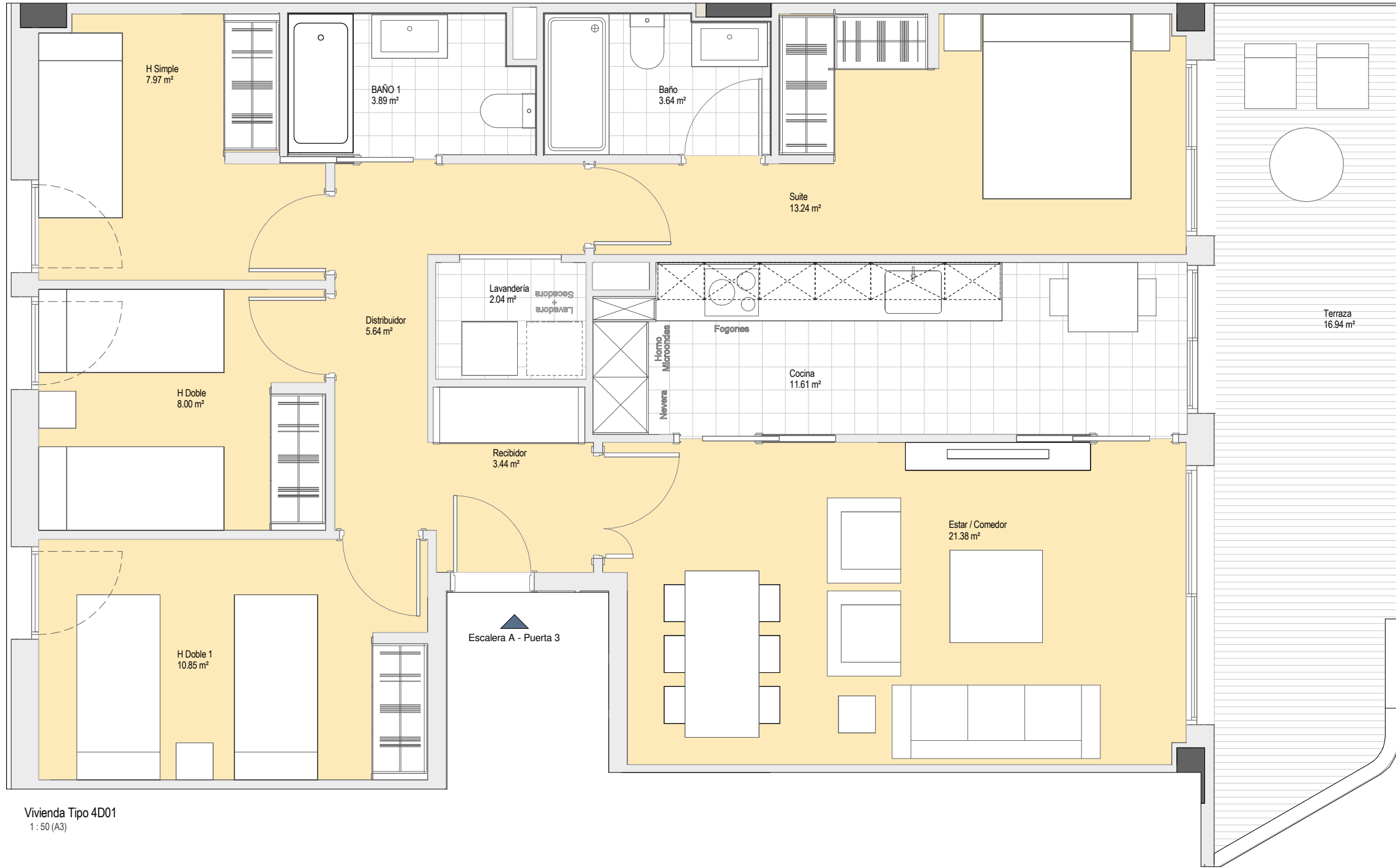
Vivienda Tipo 4D01 1:50 (A3)