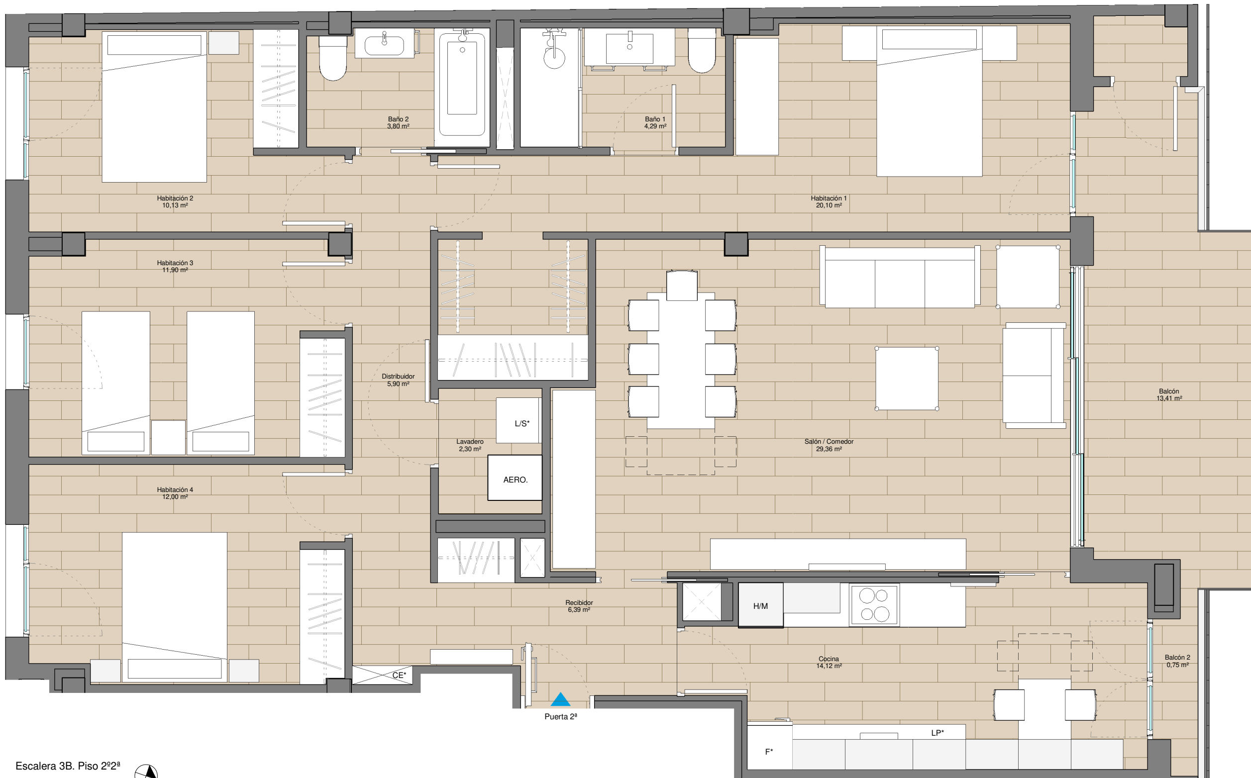
Escalera 3B. Piso 2º2ª