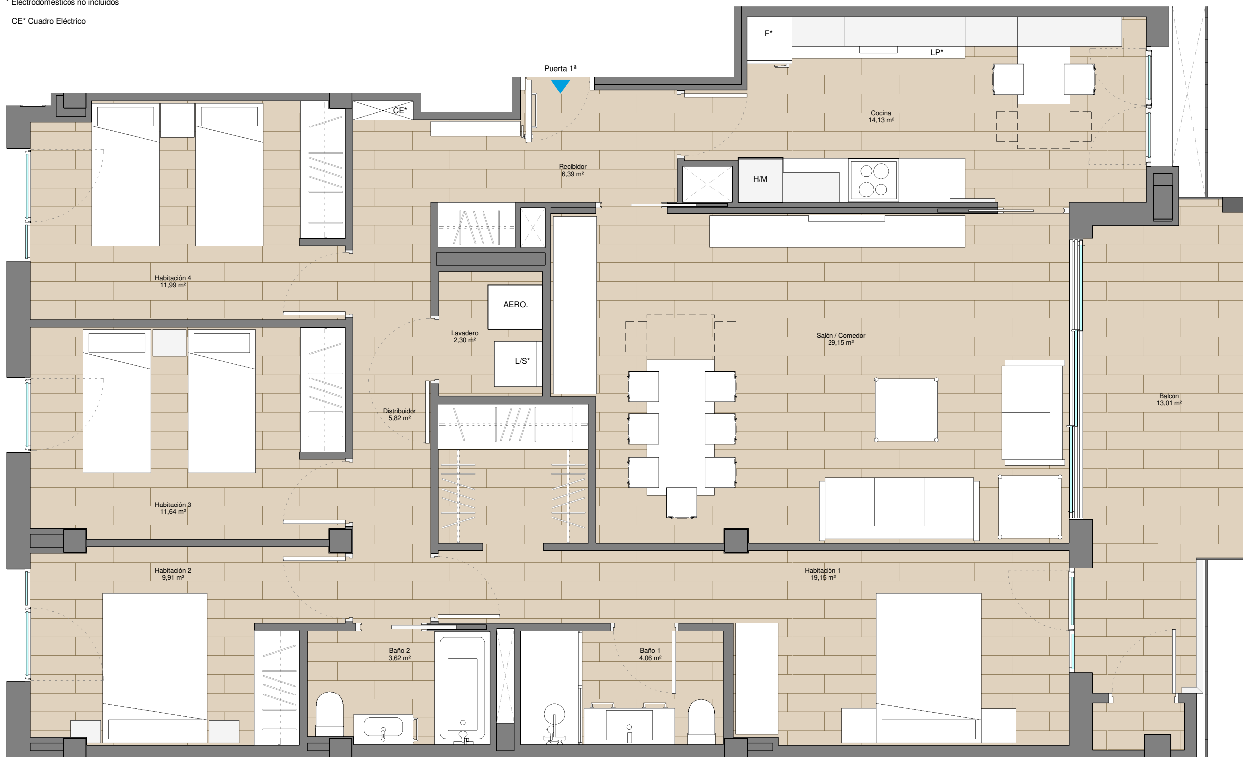
Escalera 3A. Piso 2º1ª

* Electrodomésticos no incluidos CE* Cuadro Eléctrico