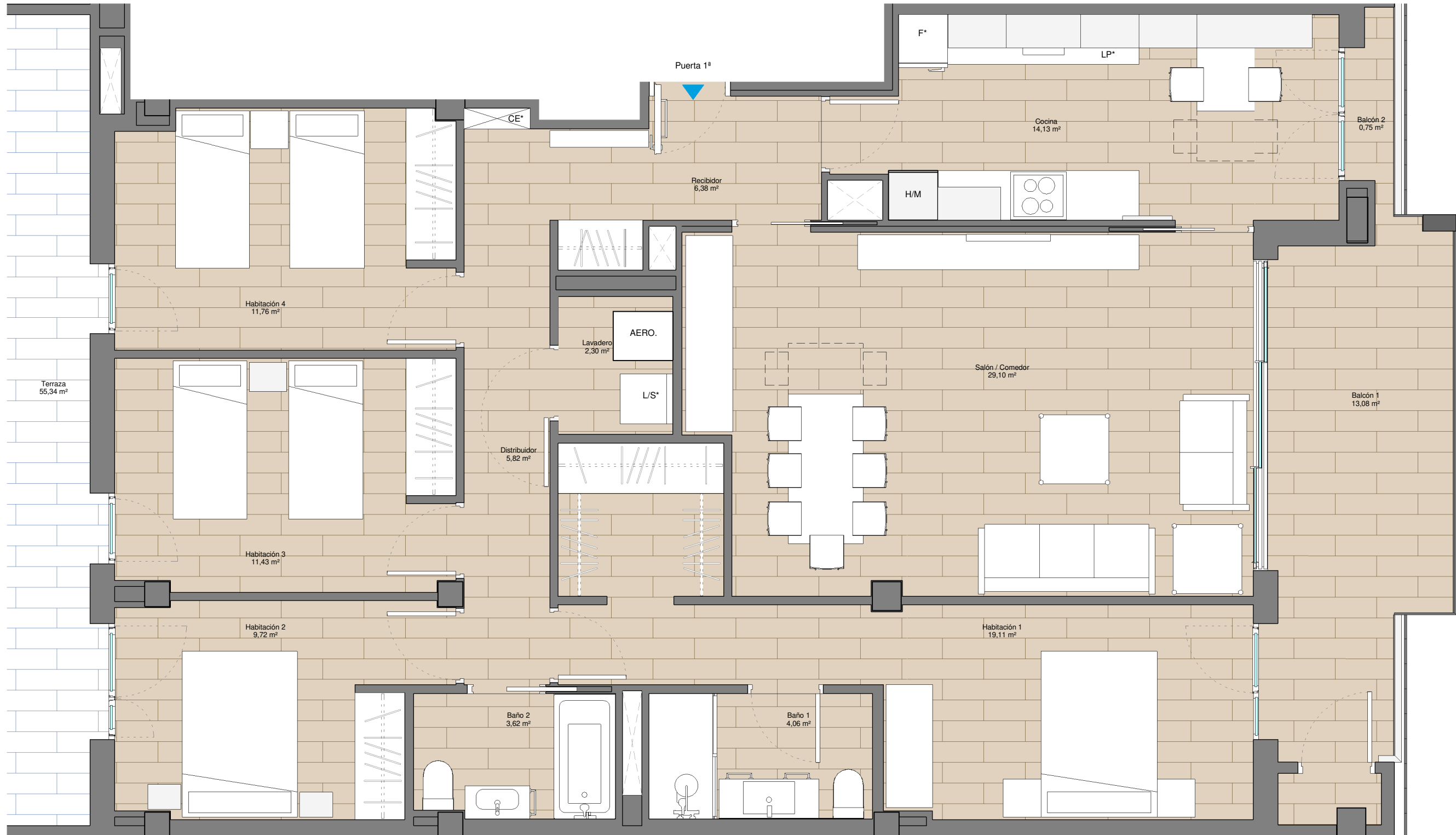
Escalera 3A. Piso 1ª1ª.

* Electrodomésticos no incluidos CE* Cuadro Eléctrico