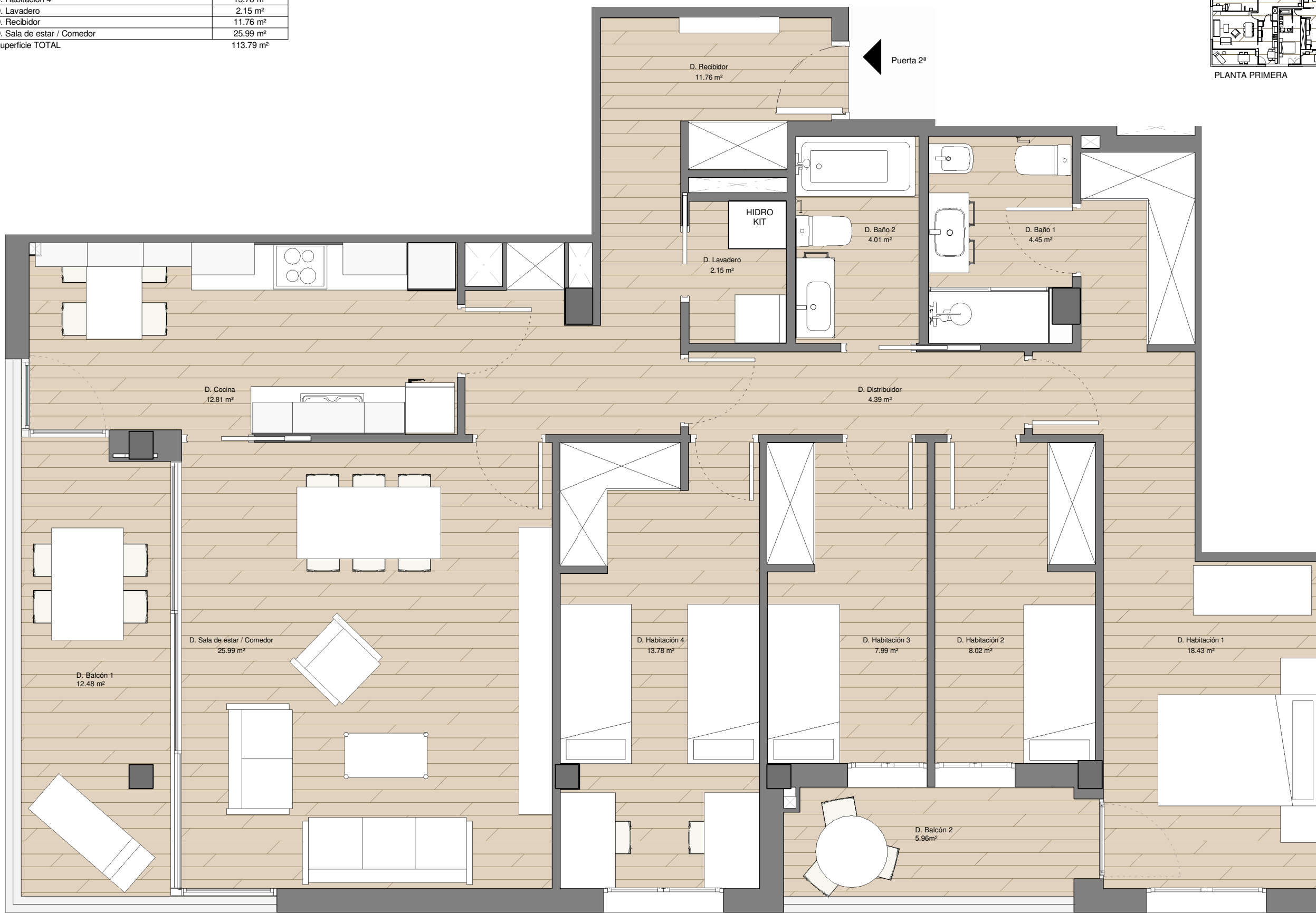
PLANTA PRIMERA PUERTA SEGUNDA